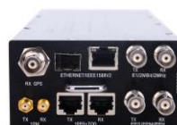
PTT8000 GE 时间分析仪模块

全球通信网络建设早已经从传统的 PDH/SDH 技术向 OTN/分组网络转移，并向最新的 STN/SPN 网络演进。同时通信网络的同步也从传统的 E1/SDH 过度到 Sync-E, 1PPS+ToD 和 IEEE1588v2 PTP 等最新的同步技术。但是，现存网络同步技术将长时间共同存在传统的 TDM 定时技术和最新的 IEEE1588v2 PTP, 1PPS+ToD 等同步技术