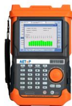
PTP-1 智能网络测试平台