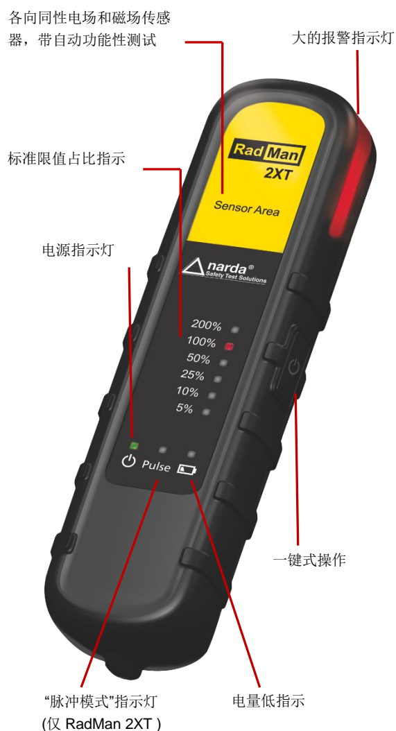
图1 前视图 - 控制和指示灯

实际监测的场强暴露可通过 LED 进行六个级别的显示，从 5% 到 200%。这里的百分比是指功率密度值对应于选定安全标准限值的比值。如果场强暴露超过限值的 50%，仪器会振动同时产生非常响的报警声。在 RadMan 2 的上部也有明亮的报警灯提示，从各个角度很容易就能看到。如果超出 100% 门限，RadMan 2 会进行连续声音报警，从而警告用户尽快离开危险区域。