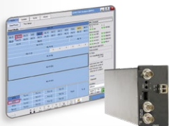
SONET/SDH测试模块 FTB-8115 – FTB-8120 FTB-8130 – FTB-8140