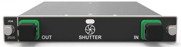
FTBx3500模块无论是否配备功率监测选件，都只会占用一个插槽。