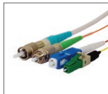
可用于 Lynx-Custom Fit™ 热熔快接