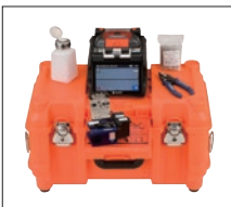
带工作台的收容箱 CC-82