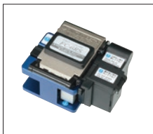
光纤切割刀 FC-6 / FC-6R 系列